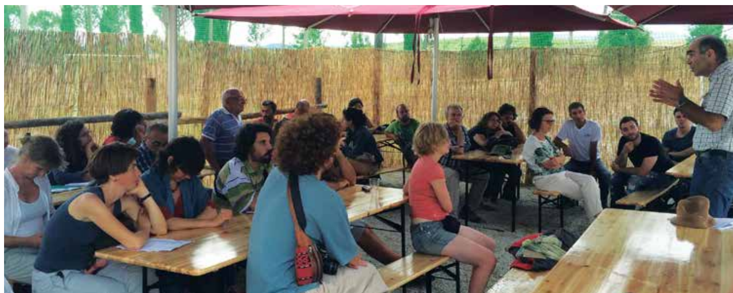
Approfondimento sulle rotazioni durante Coltiviamo la diversità! presso az. agr. Floriddia, 13 giugno 2015

Questo processo di "co-produzione" che, come abbiamo detto, inizia in campo e continua lungo tutte le fasi di produzione e trasformazione, fino al consumo finale, non potrebbe avvenire, in primo luogo, senza lo scambio di saperi tra gli agricoltori, la creazione di nuova conoscenza in collaborazione con i ricercatori, il confronto tra produttori di materia prima e trasformatori (mugnai, panificatori, pastai). Il tutto condividendo l'idea di fondo di portare avanti un processo produttivo e di realizzare un prodotto nel rispetto delle risorse ambientali impiegate e del benessere di chi quel prodotto consumerà. Questa prima fase di co-produzione di una diversa qualità richiede conoscenze e abilità, organizzazione, attrezzature e tecnologie adeguate. Le diverse esperienze attivate nei territori sperimentano propri percorsi, in contesti ambientali e umani diversi, ma laddove possibile condividono e cooperano. Ne sono esempio le forme di collaborazione tra filiere che, seppur indipendenti, si intersecano laddove si crea la necessità: la produzione della semente, lo stoccaggio della granella, la molitura. Molte giovani micro-filieri non avrebbero avuto modo di nascere e svilupparsi in un certo modo (ad esempio: avere accesso ad adeguate