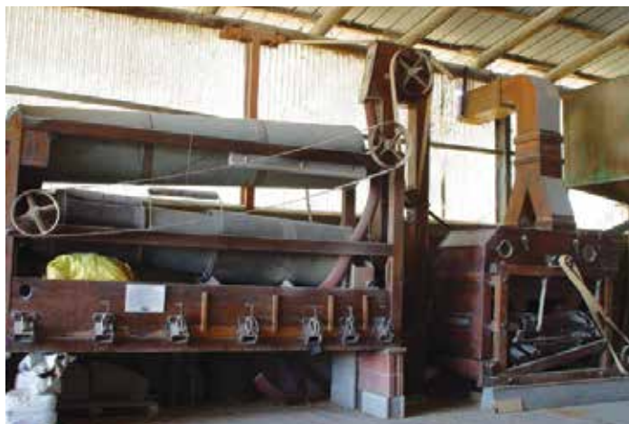
Ballarini in uso nella Coop. Valli Unite - AL

In termini generali il mugnaio delle nuove filiere risponde a due esigenze diverse. La prima è legata