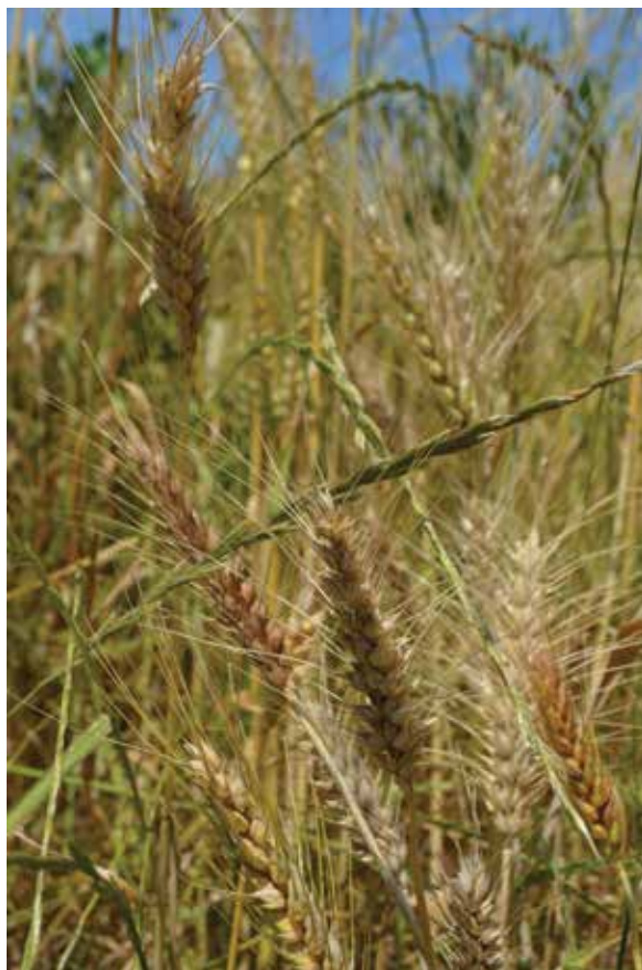
Visita ai campi di popolazione Solibam frumento tenero, Monsampolo del Tronto 2 giugno 2015

nello sviluppo di fiducia, di senso di responsabilità, di reciprocità, solidarietà e coerenza. E ancor prima nella crescita di consapevolezza. Attingendo ancora dalle parole di un agricoltore, questa è "una ricostruzione del mercato basata sulla condivisione di consapevolezza". Sono dunque processi lenti, non scontati, che vanno adeguatamente curati. Anche in questo caso lo scambio tra esperienze sui territori o tra territori può aiutare molto, gli incontri organizzati da Rete Semi Rurali nell'ultimo anno lo hanno fatto emergere con chiarezza.