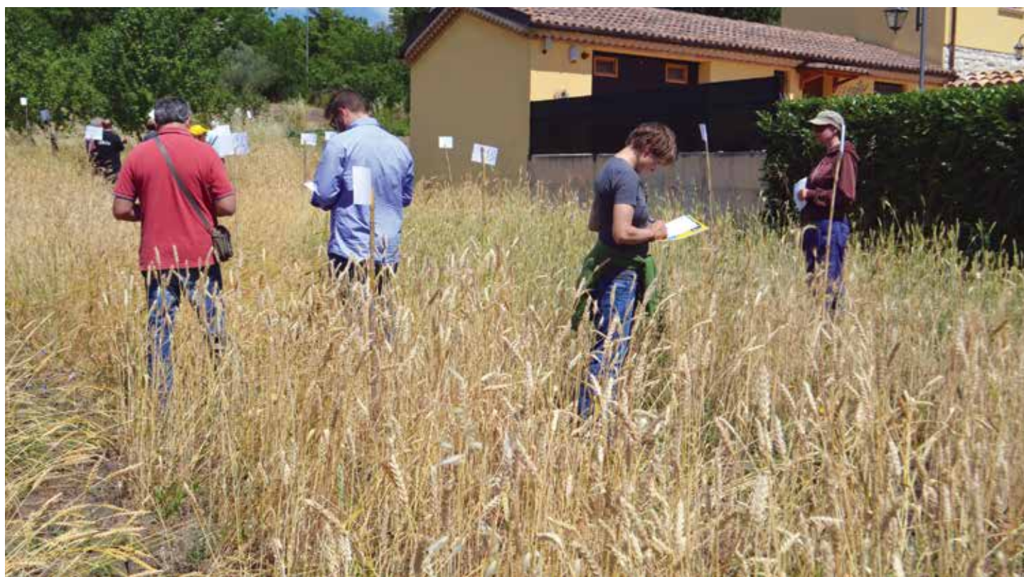
Rilievi sul campo sperimentale RSR presso az. agr. Battezzato, Contrada Colle Calcarea, 26 giugno 2015

Dalle discussioni di queste giornate e dall'analisi dei questionari compilati sono emersi alcuni temi che ci sembra debbano essere messi al centro del futuro impegno comune e sui quali lavoreremo nell'incontro FILIGRANE 2 che si terrà il 9 e 10 ottobre 2015.